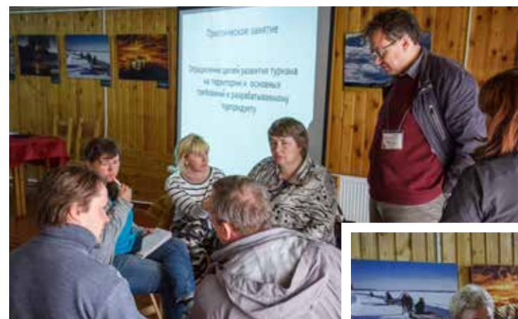
Практикумы стали местом рождения новых турпродуктов

Эксперты семинара постарались на понятных примерах объяснить принципы разработки турпродуктов: от создания рабочей группы до запуска рекламной кампании