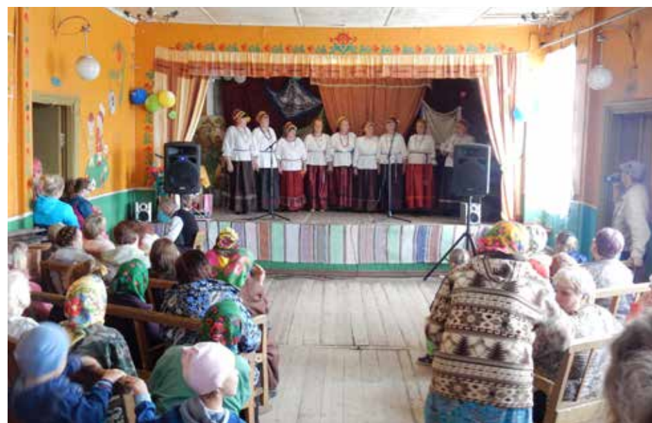
Какой же праздник без песни!