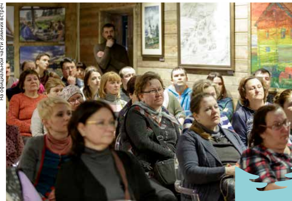
На официальной части Зимних встреч

Конец февраля — то время, когда в заснеженную деревню Вершинино едут гости со всех концов Кенозерского национального парка.