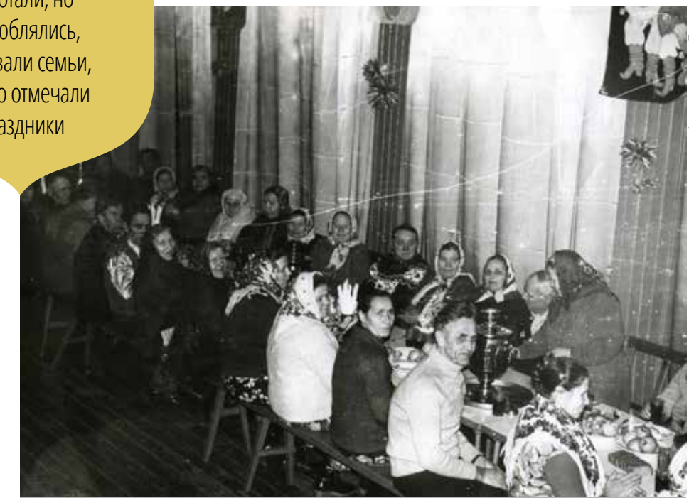
Встреча ветеранов труда в клубе посёлка Поча

Такова история создания и периода расцвета посёлка Поча. Сейчас посёлок изменился: мало рабочих мест, молодежь уезжает, в детском саду и школе всё меньше детей. Но жители Почы не желают забвения своего родного посёлка, они начинают понимать, что источником занятости, дополнительного дохода, творческого саморазвития для них может стать сельский туризм. И главным партнёром, и помощником на этом пути для них станет Кенозерский национальный парк. ■