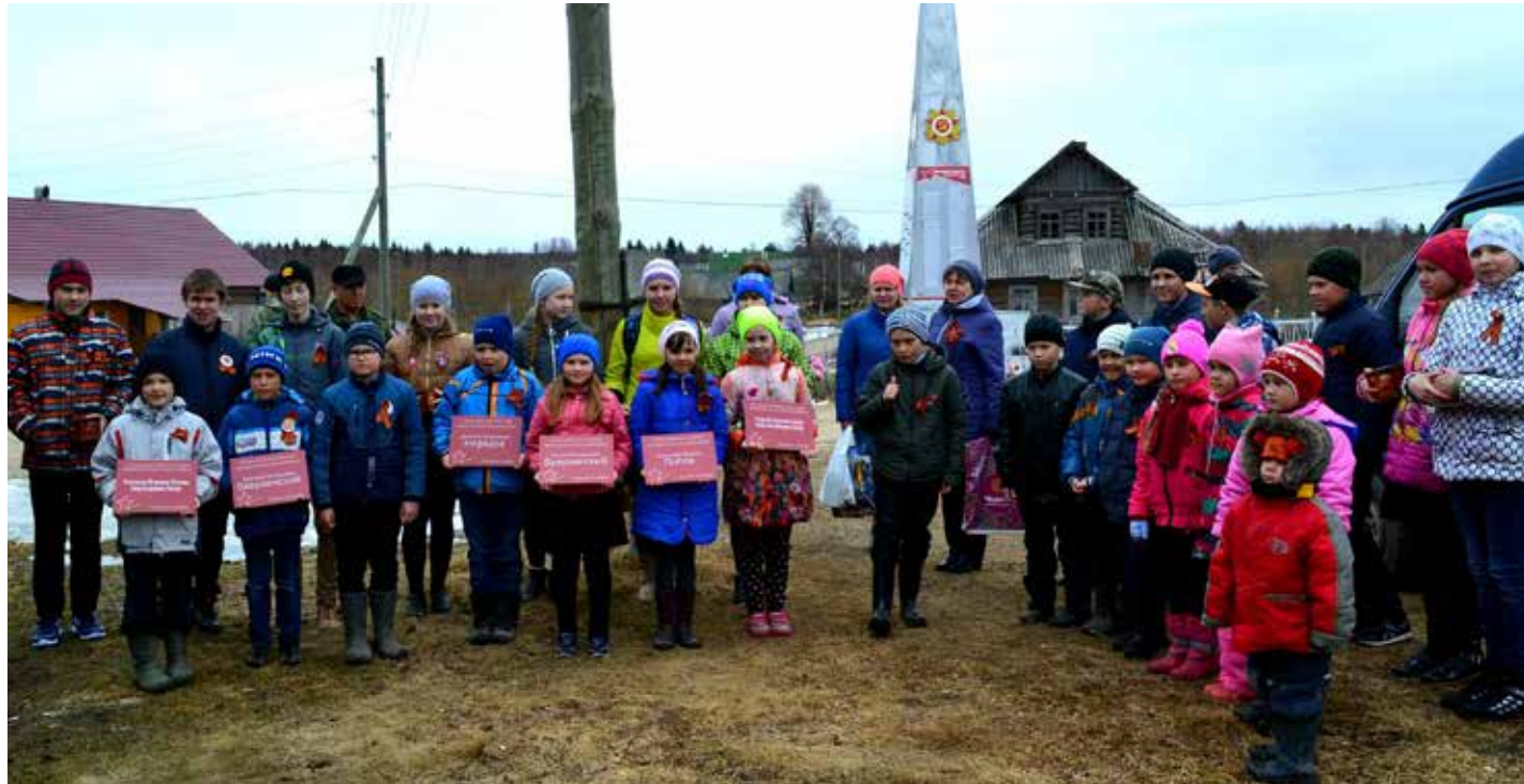
Ученики лекценозерской школы у обелиска в д. Морщихинская.