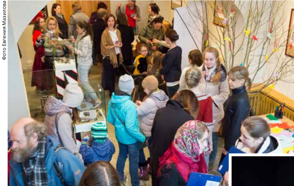
Программа праздника в визит-центре Кенозерского национального парка привлекла многих горожан