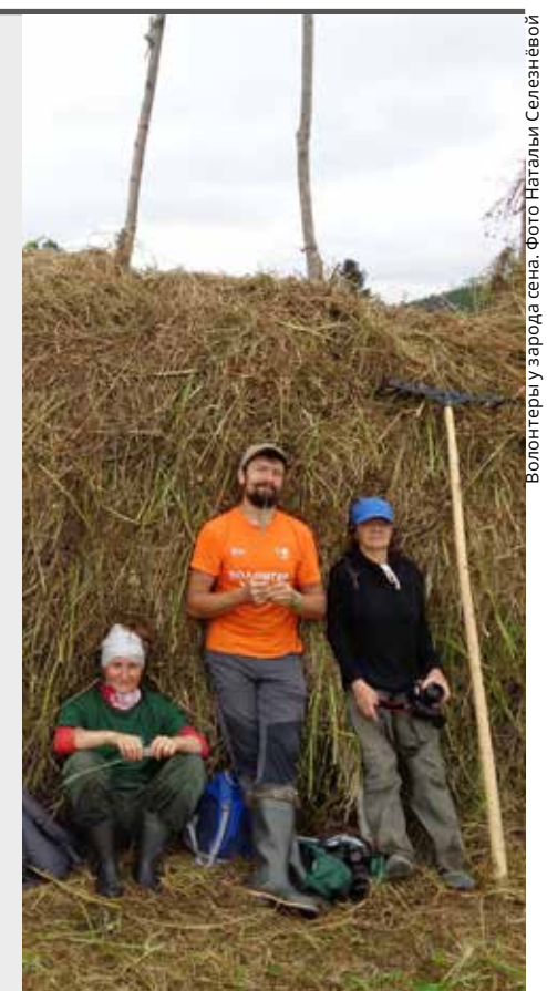
Волонтеры у зарода сена.