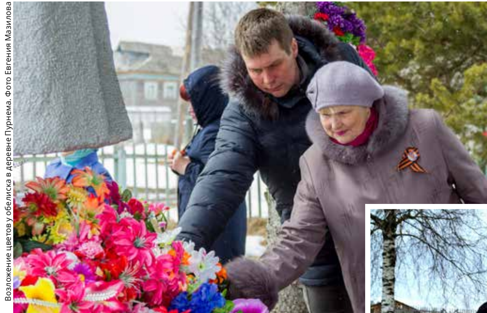
Возложение цветов у обелиска в деревне Пурнема.

9 мая, в день празднования 72-ой годовщины Победы, в девяти деревнях Онежского полуострова и Кенозерья прошли торжественные митинги у обелисков и памятников воинам-освободителям. Местные жители — взрослые, учащиеся школ, сотрудники национальных парков — почтили память ветеранов и тружеников тыла минутой молчания, возложили цветы. Жители деревень присоединились и к международной акции «Бессмертный