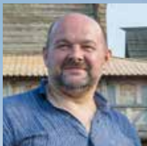
Игорь Анатолевич Орлов, Губернатор Архангельской области

Природа — это не просто источник неисчерпаемых ресурсов. Отношение к ней является прямым показателем цивилизованности общества. Общей глобальной задачей для всех является формирование нового типа взаимоотношений человека и природы. Для нашего региона — это особенно актуально.