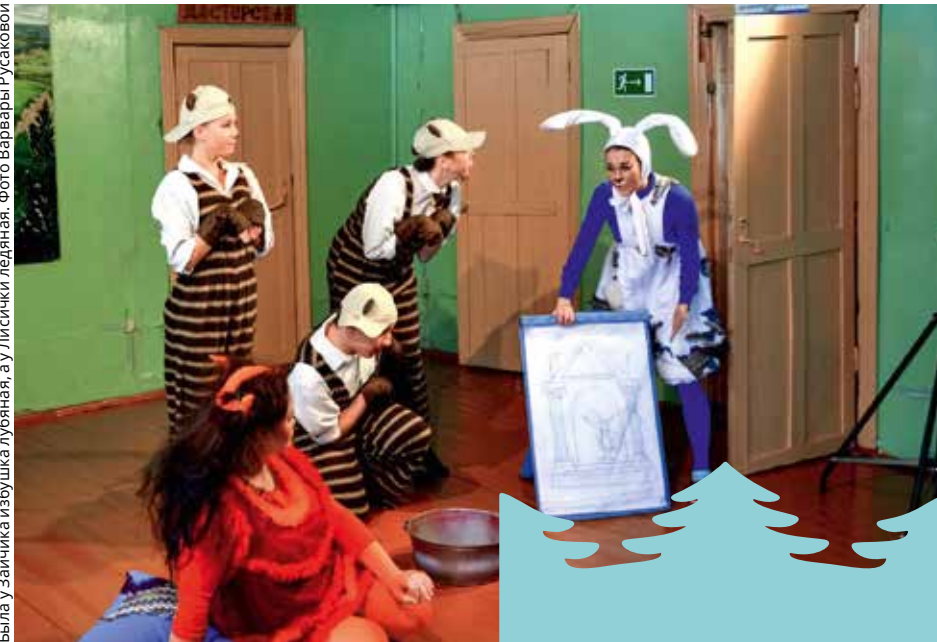
Главные действующие лица музыкальной сказки «Клочки по закоулочкам» во всей красе

Была у Зайчика избушка лубяная, а у Лисички ледяная.