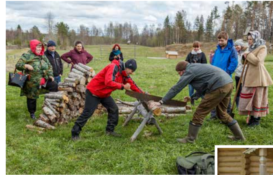
Интерактивная программа в Архитектурном парке «Кенозерские бирюльки»

ных промыслов и ремёсел, сохранение природного и историко-культурного наследия.