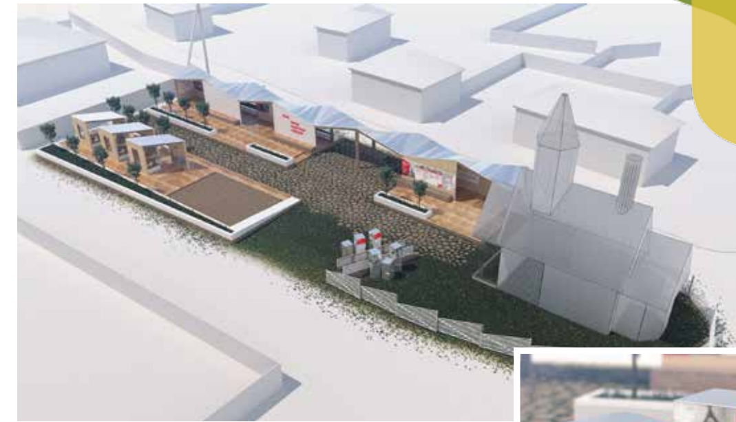
Визуализация стендов Информационного центра

Историю Волошевского лесопункта сложно представить отдельно от истории лесозаготовок в Архангельской области и в стране целом. В период становления лесозагото-