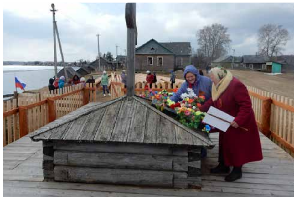
Жители деревни Усть-Поча возлагают цветы в память о воинах-земляках

Администрация Парка выражает благодарность жителям Кенозерья, украсившим свой дом табличкой с именем прежнего хозяина — участника Великой Отечественной войны.