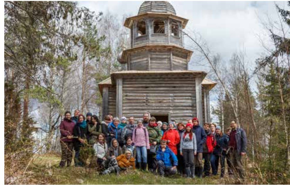
Участники стажировки на фоне церкви Александра Свирского на Хижгоре

Развитие туризма на особо охраняемых природных территориях, брендирование территорий, формирование и продвижение турпродуктов с учетом интересов и потребностей разных целевых групп — всего лишь ряд тем, которые сумели обсудить участники семинара-практикума «Разработка турпродуктов для особо охраняемых природных территорий: проектирование, повышение конкурентоспособности, продажи», прошедшего в Кенозерском национальном парке с 29 мая по 2 июня.