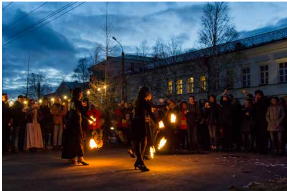
Файер-шоу «Цитра Солис». Фото Евгения Мазилова

Десятки мастер-классов и бразильские барабаны, благотворительная ярмарка и файер-шоу, кукольный театр и рок-концерт, северные угощения и экоквест, лошадки, собачки и даже... белый медведь. Всё это разнообразие предстало вниманию публики в Ночь музеев, прошедшую у Визит-Центра Кенозерского национального парка 20 мая.