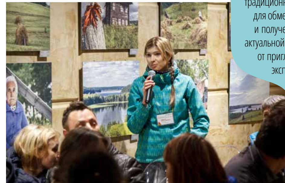
Аудитория всегда находила, что спросить у спикеров

Семинар-практикум в Кенозерье — традиционная площадка для обмена опытом и получения самой актуальной информации от приглашённых экспертов