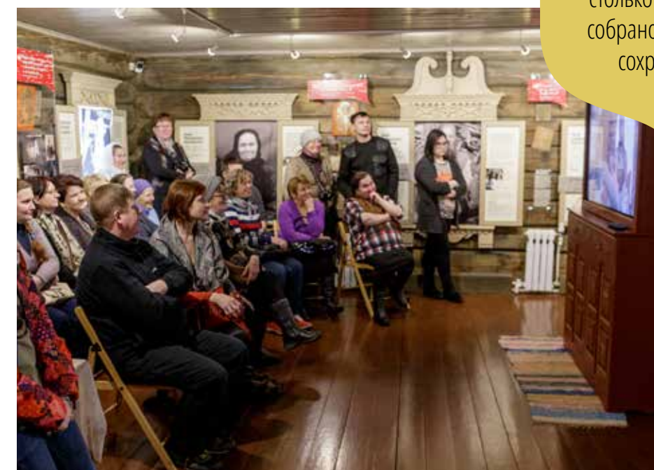
В музее «В Начале было Слово»