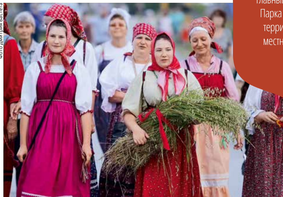
Местные жители являются постоянными участниками мероприятий Парка и надежными помощниками в осуществлении его самых амбициозных проектов