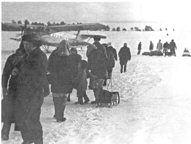
Прилет самолета. Деревня Лопшеньга.

«не с поля ждем, а с моря». В экспозиции будет представлен подлинный поморский календарь, регламентировавший жизнь людей по заходу рыбы и морского зверя в места лова. Например, важными были дни Николы Зимнего и Василия Великого, когда начинался подледный лов на ваги, Рождества и Крещения Господня, когда проходила путина сельди, Сретения, с началом которого открывался промысел белух 8 .