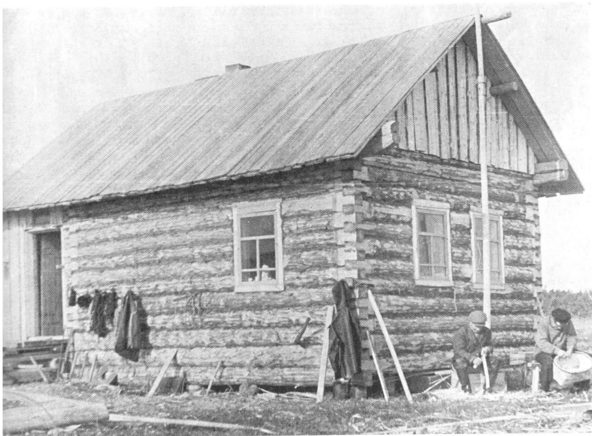
Рыболовецкая тоня «Спасское» на берегу Белого моря. 1970-е гг.