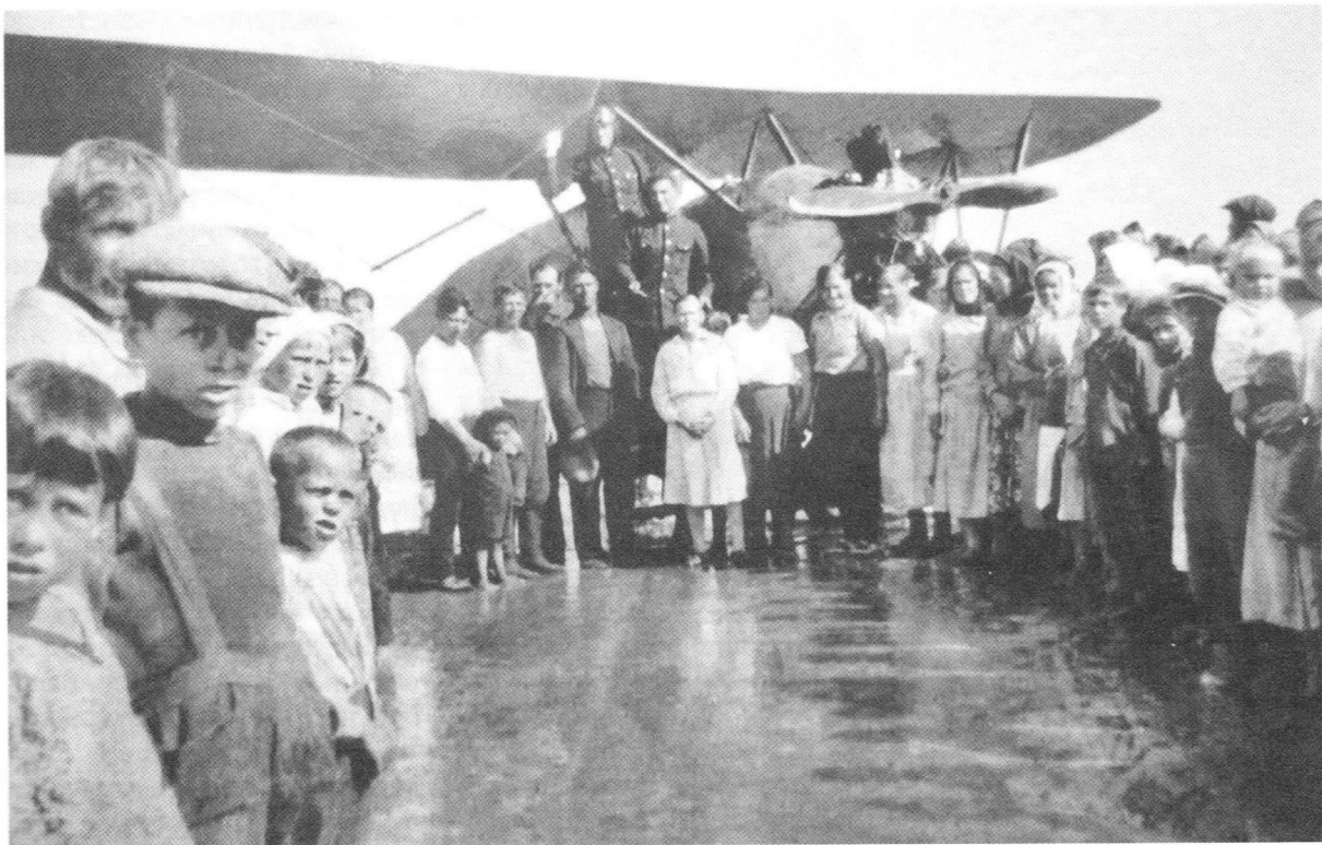
Первый рейс санавиации в Архангельской области Кегостров–Лопшеньга. Август 1937 г.