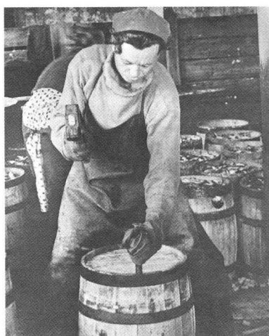
Переработка сельди. 1970-е гг.

Издревле на каждом отрезке беломорского побережья водились «свои» виды рыб. На Кандалакшском берегу, на-